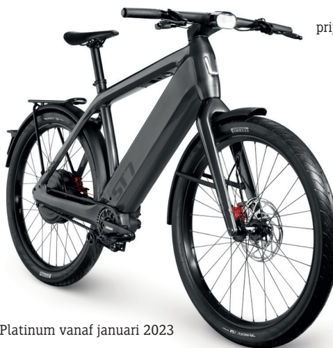
Dark Platinum vanaf januari 2023