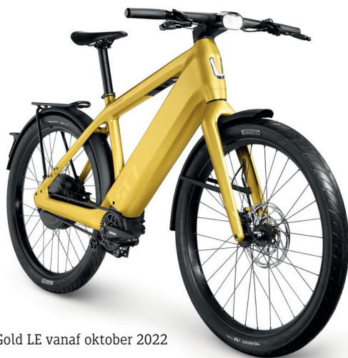
Solid Gold LE vanaf oktober 2022