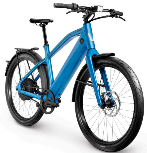
Stromer Amsterdam Double Bag 30 l